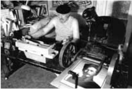
Основатель этнографического парка с ещё не конфискованным улемётом «Максим»

приходят? Увидят памятник Ленину, стоящий в уголке, посвящённом маргеновцам, хихикнут: «А-а, Вова! И ты здесь?» Или есть у нас репродукция известной картины Перова «Охотники на привале» с полым пространством вместо голов. Вот тут, где надо головы свои просовывать и, фоткаясь, кривляться, — они могут плясать и кричать, и визжать до упаду.