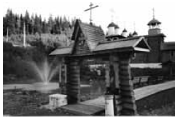
Вход в храм св. Георгия в постниковском парке

И — сгорела. Но до этого я позвонил нашему начальнику милиции: «Ваши дурацкие сделали то, что нельзя делать ни в коем случае, — зашли в алтарь и бабу туда затащили! Нужно немедленно переосвятить храм. Везите священника». С того конца провода доносится: «А у меня бензина нет». — Вместо сгоревшей церкви вы построили новый, красивый храм Святого Георгия. Двери, я вижу, в него, как правило, всегда открыты. При этом вы сами рассказали, что пару раз из него уже крали иконы. Вы вешаете на место прежней новую, прикручиваете на сей раз шурупами — всё равно, вырывают «с мясом». Но двери в храм не закрываете.